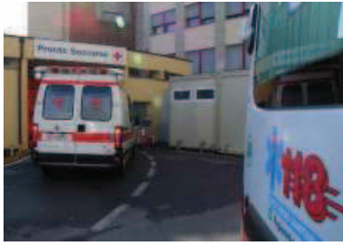
Un'ambulanza entra nel pronto soccorso di Crema e a destra il luogo dello schianto

Lo schianto risale a ieri mattina. È la dinamica, per quanto al vaglio della polizia stra-