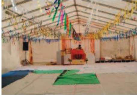
A sinistra gli indiani che stanno organizzando e curando la realizzazione del nuovo tempio, qui sopra il tendone provvisorio che sarà adibito alla preghiera e sotto la vecchia cascina di Isoello dove verrà costruito il tempio