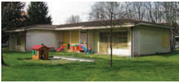
Uno scorcio della scuola materna di Grontardo