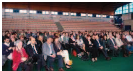
I soci allo spettacolo nella palestra di via Toffetti

PalaBertoni pieno. Circa cinquecento, fra bambini e bambine, hanno animato la palestra con le esibizioni