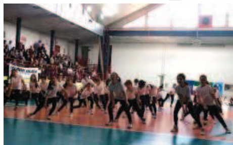
Nelle tre foto alcuni dei gruppi che ieri hanno partecipato alle Olimpiadi della danza nella cornice del PalaBertoni

Protagonisti sono stati circa cinquecento allievi delle scuole elementari, medie e superiori della città, che nelle scorse settimane si sono avvicinati alla danza sotto la guida di un team di insegnanti e coreografi. Ogni classe ha preparato una breve esibizione, mostrando i frutti del lavoro davanti a parenti e amici. Centinaia le presenze sugli spalti,