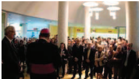
La benedizione del vescovo Cantoni ieri mattina nella sede della banca

La prima sede a San Bernardino, aperta nel 1892. Risposta in massa dei soci già ieri mattina. Grande soddisfazione del presidente