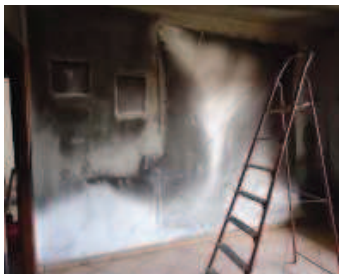
Una delle stanze della villa devastata dal rogo dello scorso ottobre, e in alto la piccola Tosca