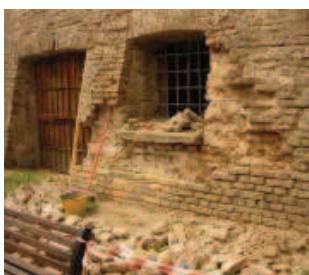
Due immagini del cantiere aperto presso le mura di Gera