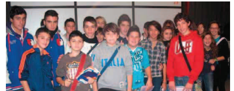
La classe 3 a H della scuola media Virgilio

Ieri nello stand del giornale «La Provincia» sono stati tanti i ragazzi che hanno con inte-