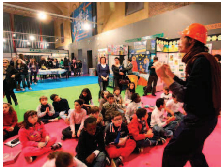
L'animazione di orientamento nella scelta della scuola media