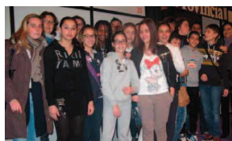
La 3 a A dell'istituto comprensivo Bertesi di Soresina