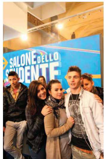
Studenti all'ingresso di Santa Maria della Pietà