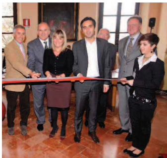
Il taglio del nastro della 17 a edizione del Salone