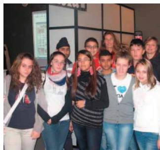
La classe 3 a della media di Casalmorano

Ragazzi protagonisti nel cuore delle notizie con «La Provincia»