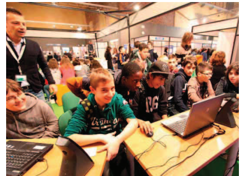
Bambini allo stand dell'Asl sulla prevenzione al gioco d'azzardo