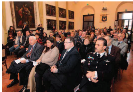
Le autorità intervenute all'inaugurazione