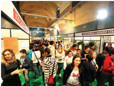
Studenti fra gli stand in Santa Maria della Pietà

Ieri al via la diciassettesima edizione della kermesse. Ogni classe partecipa a un laboratorio e a un incontro orientativo, poi visita gli stand. Ieri presenti 700 ragazzi