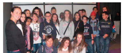
La classe 3 a A della media di Ostiano