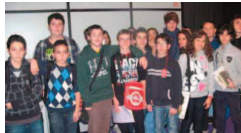
La classe 3 a C della scuola media Virgilio