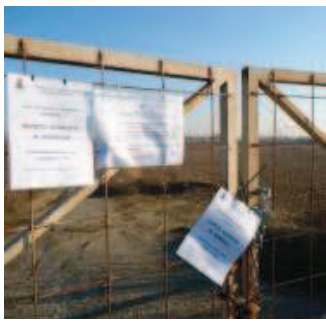
L'ingresso al sito posto sotto sequestro