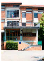
La sede del Politecnico