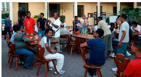
Una 'cena multietnica' alla Casa dell'Accoglienza

Domenica, alle 15.30 nella chiesa di Santa Lucia, il vescovo Dante Lafranconi celebra l'Eucaristia per i migranti cattolici presenti sul territorio.