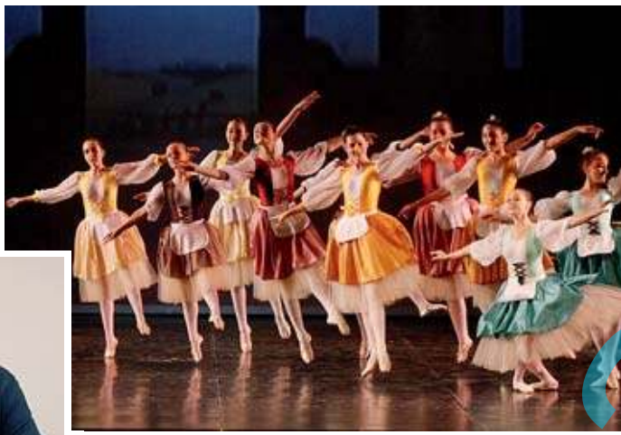
Miglioli e, qui sopra, Dance Studio C

Le due serate (lo stesso spettacolo sarà replicato giovedì sera alla stessa ora, sempre al Filo) sono state pensate sia