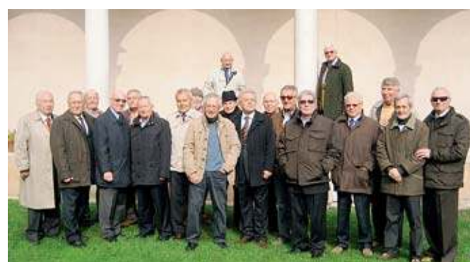
Il gruppo di diplomati della VB Beltrami del 1959 nel chiostro di S. Abbondio

Si è svolto nei giorni scorsi il cinquantaduesimo raduno annuale dei diplomati della quinta B dell'Istituto tecnico per ragionieri «Eugenio Beltrami» nell'anno scolastico 1958-1959. Ecco la foto ricordo scattata alla ventina di partecipanti nel chiostro del complesso monumentale di Sant'Abbondio in occasione dell'incontro, dopo la visita alla chiesa, al chiostro e al Museo lauretano. Vivo l'apprezzamento per il Museo con l'auspicio che sia più di frequente aperto al pubblico. E' seguita la conviviale al ristorante Dordoni. Già fissato l'appuntamento per l'autunno del prossimo anno.