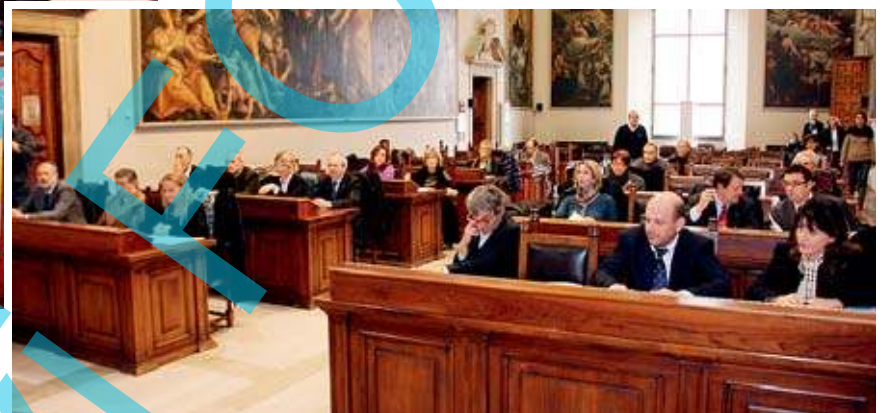
Sponsor e rappresentanti delle Fondazioni presenti nel salone dei quadri

La formula Junior prevede laboratori, concorsi incontri con gli autori e progetti di partecipazione