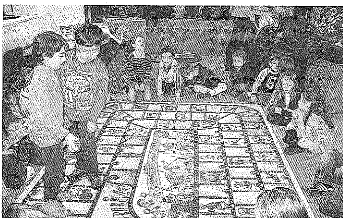
Bambini coinvolti nel laboratorio promosso dall'Asl