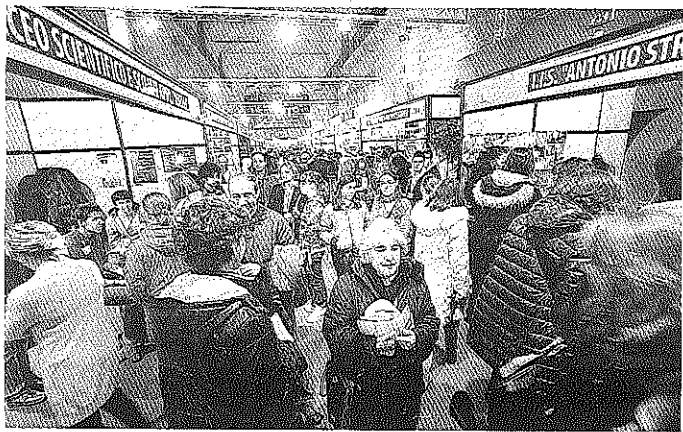
Grande afflusso di gente ieri pomeriggio al Salone dello Studente