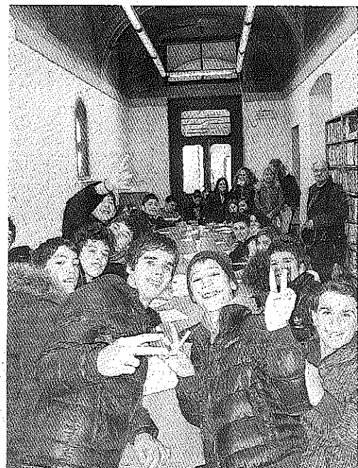
Studenti durante un laboratorio espressivo