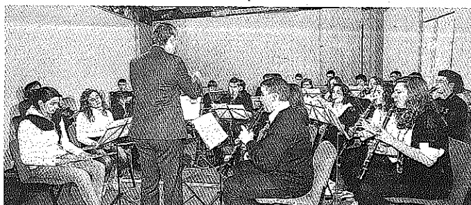
I giovani musicisti del progetto Mousiké, I Fiati Ponchielli