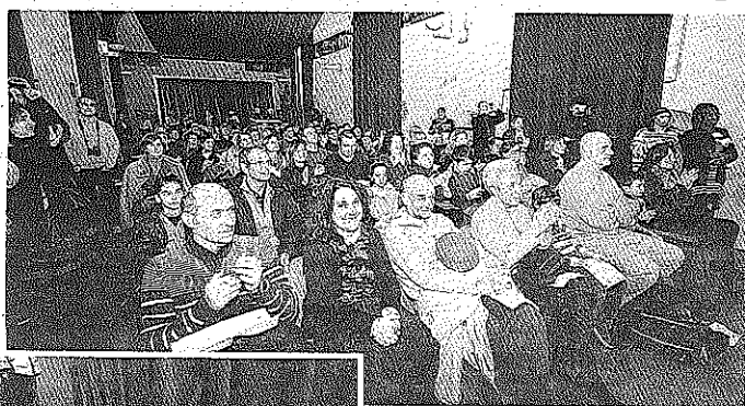
Sala Rodi ieri gremita per il concerto

Circa 3.000 i ragazzi, suddivisi in 39 le classi delle scuole primarie, 95 quelle delle medie, per un totale di 260 docenti accompagnatori hanno visitato il Salone nelle quattro mattinate. Partecipati i numerosi i laboratori disseminati nelle sale adiacenti a Santa Maria della Pietà, ma il cuore della manifestazione è rimasto lo spazio riservato agli stand. Ieri la testimonianza dell'apprezzamento riservato dalla manifestazione è stato dato dalla presenza massiccia di genitori e ragazzi che hanno visitato gli stand, chiesto informazioni. Dati certi sull'incidenza che il Salone ha sull'orientamento nella scelta della scuola non ci sono, o perlomeno non sono stati resi pubblici, ma sta di fatto che al Salone dello Studente le famiglie e i ragazzi sanno di poter tro-