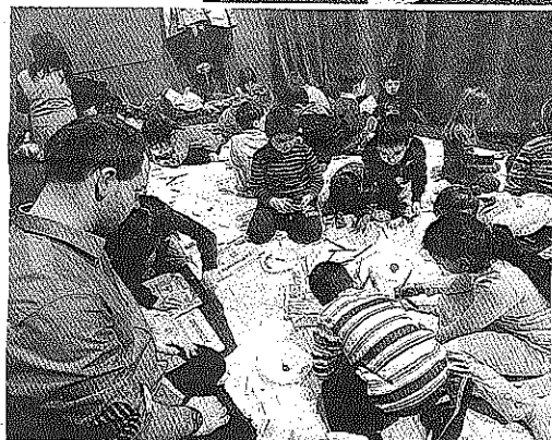
Il laboratorio del Munari