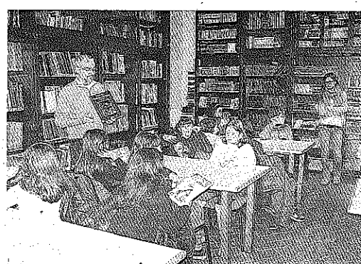
Il laboratorio fulmine del centro fumetti Pazienza