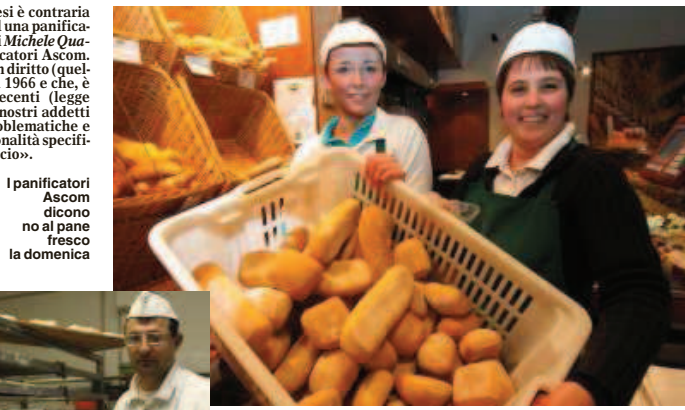
I panificatori Ascom dicono no al pane fresco la domenica

«Se non ci si vuole limitare all'ambito strettamente economico, poi, a rischio è la qualità e l'identità culturale legata al pane. Il divieto di produzione e di vendita domenicale e festiva del pane, infatti, va