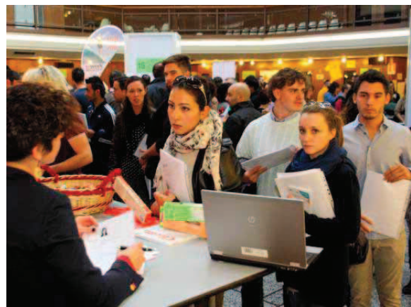
CREMONA — Centinaia di giovani in cerca di un posto di lavoro. Il senso del Job day, l'iniziativa che si è svolta nella sala Borsa della Camera di Commercio, a cura dell'Informagiovani, è nella speranza di tutti i ragazzi, cremonesi e non, che ieri hanno preso d'assalto gli stand allestiti dalle aziende. Domanda e offerta di lavoro hanno cercato un punto d'incontro (Staboli a pagina 18)