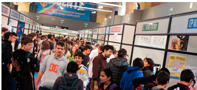
Gli studenti in Santa Maria della Pietà per il Salone dello studente