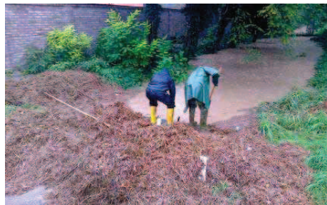
I lavori nei pressi del colatore Pippia