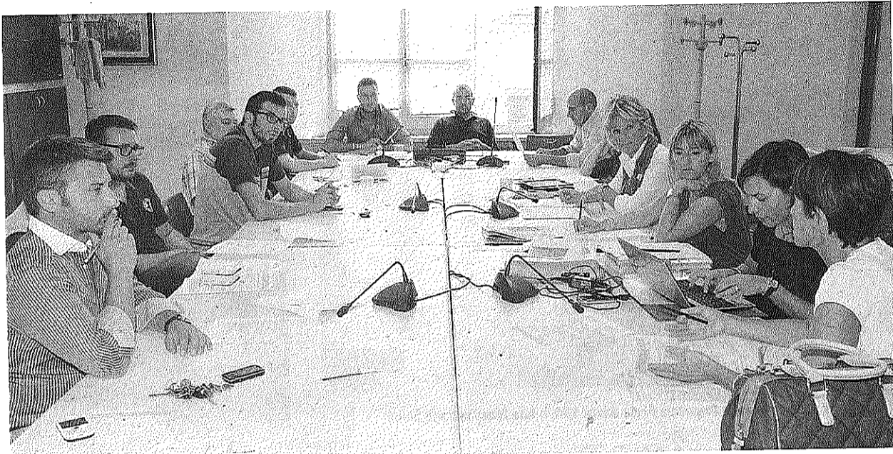
Del salone dello studente se ne è parlato ieri pomeriggio nella commissione Politiche educative

«Non posso che esprimere il mio disappunto, e voglio che questo sia messo a verbale, oltre che la mia